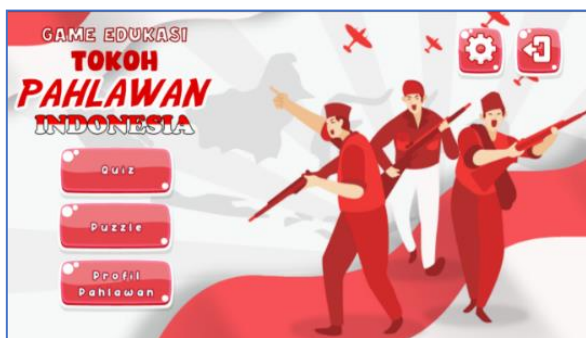
Gambar 2 Halaman Utama

Halaman Utama adalah halaman yang pertama kali ditampilkan ketika game dimulai. Halaman utama berisi menu dari game edukasi tokoh pahlawan Indonesia. Berikut tampilan halaman utama game yang dapat dilihat pada Gambar 2.