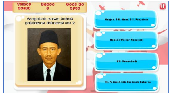
Gambar 3 Halaman Game Quiz

Halaman game quiz adalah halaman yang berisi game quiz yang bisa dimainkan. Berikut tampilan halaman game quiz yang dapat dilihat pada Gambar 3.