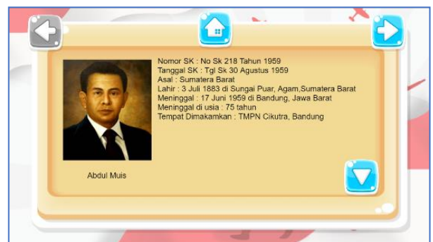
Gambar 5 Halaman Profil Pahlawan

Halaman profil pahlawan menampilkan profil dari pahlawan Indonesia. Profil pahlawan berisi informasi dari pahlawan. Berikut tampilan halaman profil pahlawan yang dapat dilihat pada Gambar 5.