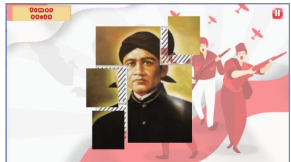
Gambar 4 Halaman Game Puzzle

Halaman game puzzle adalah halaman yang berisi game puzzle yang bisa dimainkan. Berikut tampilan halaman game puzzle yang dapat dilihat pada Gambar 4.